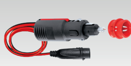
Cigarettändarkit 35 cm - 029439