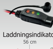
Laddningsindikator 56 cm