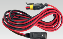
Förlängning 2,5 m - 029057