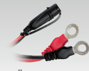
Öljettkontakt 45 cm - M6 029194