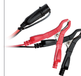
Klämmor (45 cm)